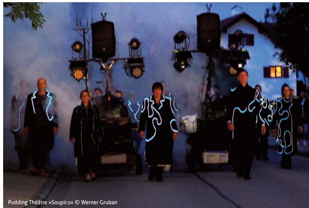
Pudding Théâtre »Soupir.«

Theaterforum Gauting e.V. c/o bosco, Bürger- und Kulturhaus Gauting Oberer Kirchenweg 1, 82131 Gauting Telefon: 089 / 452 385 80 info@bosco-gauting.de • www.bosco-gauting.de Öffnungszeiten DI, DO, FR 10:00 – 12:30 | 15:00 – 18:00 MI 10:00 – 12:30 | SA 10:00 – 12:00