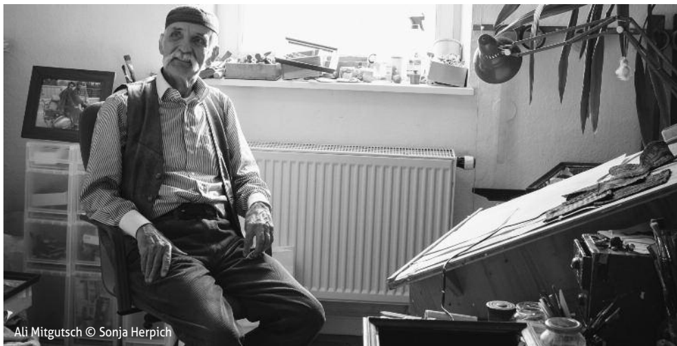
Ali Mitgutsch

THEATERFORUM GAUTING E.V. | FOTOAUSSTELLUNG SONJA HERPICH · »Zimmer Nr. 2«