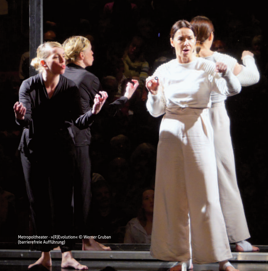
Metropoltheater · »(R)Evolution« (barrierefreie Aufführung)