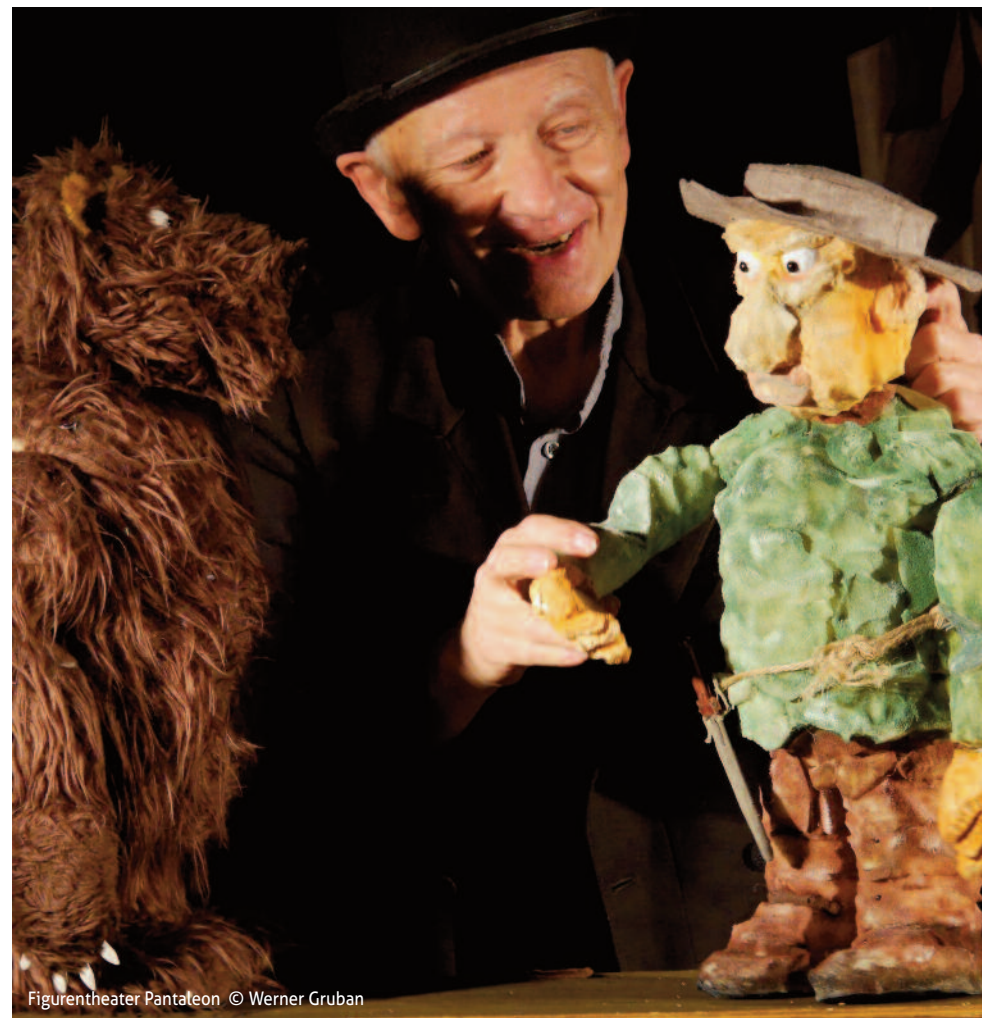
Figurentheater Pantaleon